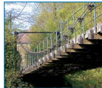
Conflandey: Die Hängebrücke zum Schloss ist eine sehenswerte Konstruktion.

Am RU liegt Port d'Atelier Village, das leider keinerlei Einkaufsmöglichkeiten bietet. Wer etwas benötigt, muss nach Port d'Atelier am LU hinaufgehen (ca. 1 km). Dort gibt es eine Bäckerei, die auch Lebensmittel verkauft. Der für die verschlafene Gegend unwahrscheinlich große Güterbahnhof in Port d'Atelier dient der Versorgung der Usine Conflandey, ein Betrieb, der in einigen weiteren Orten (unter anderen in Conflandey) Produktionsstätten für Rohre unterhält.