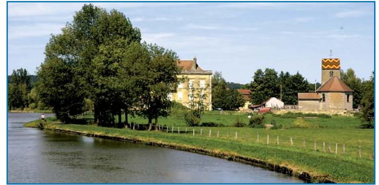
Montureux: Schloss und Kirche am unteren Ortsende.

Der örtliche Fleischer ist leider ohne Nachfolger in Pension gegangen, dafür ist noch ein nettes Waschhaus zu erwähnen.